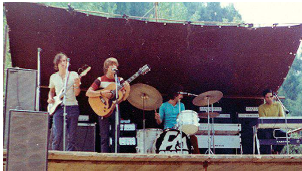
"The We", il gruppo bolzanino sul palco Pop Free Festival di Brunico nel 1970

per non urtare l'ego smisurato che caratterizza i nostri animali da palcoscenico. La difficoltà principale è stata quella di dover mettere un punto finale al libro, ben sapendo che cinque minuti dopo averlo inviato alle stampe sarebbe potuto squillare il telefono per ricordarci magari di un tale che negli anni Sessanta aveva diviso l'appar-